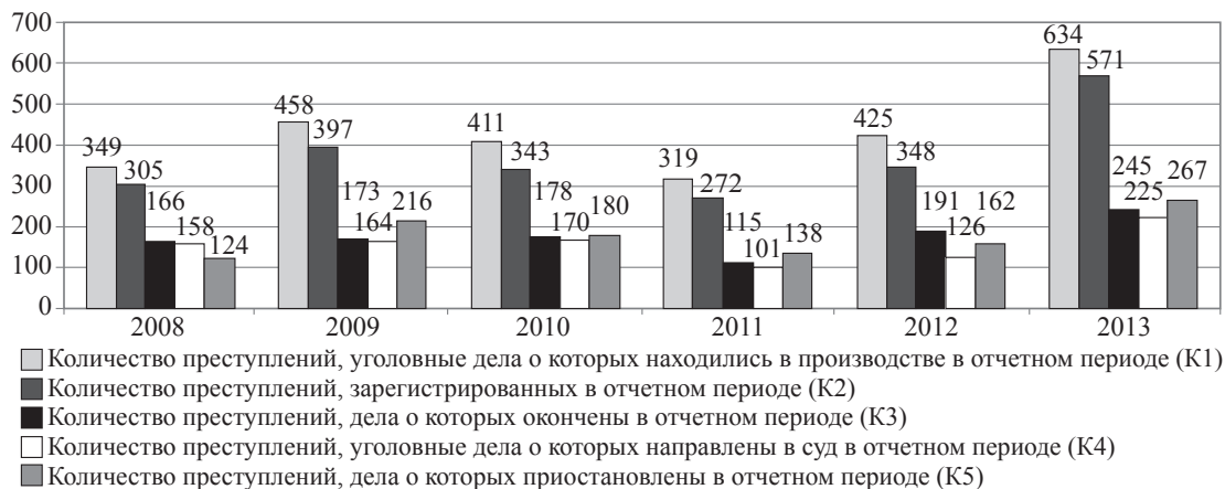
Рис. 2. Распределение числа экологических преступлений в Республике Казахстан с 2008 по 2013 г.

Важным показателем эффективности борьбы с экологическими преступлениями является количество приостановленных дел. Из рис. 2 видно, что с 2008 по 2013 г. количество приостановленных дел не уменьшалось и, как правило, чуть менее половины дел приостанавливалось. В 2013 г. количество приостановленных дел в общей структуре экологических преступлений составило 46,8 %. В основном дела приостанавливаются по п. 1 ч. 1 ст. 50 за неустановлением лица, подлежащего привлечению в качестве обвиняемого.